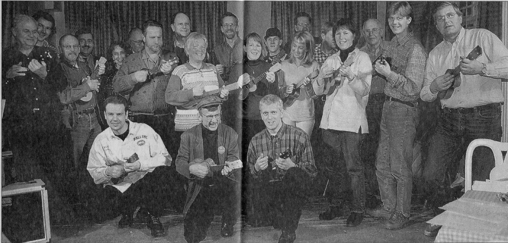
Scenglädje. Ett uppskattat inslag i kvällens program är att gemensamt spela gamla favoritlåtar. Om man ska tro entusiasterna kan man spela det mesta på ukulele. Och det låter dessutom förvånansvärt bra.

– Den är aldeles lagom stor för dem, så det vore roligt om musiklärarna vågade satsa på det.